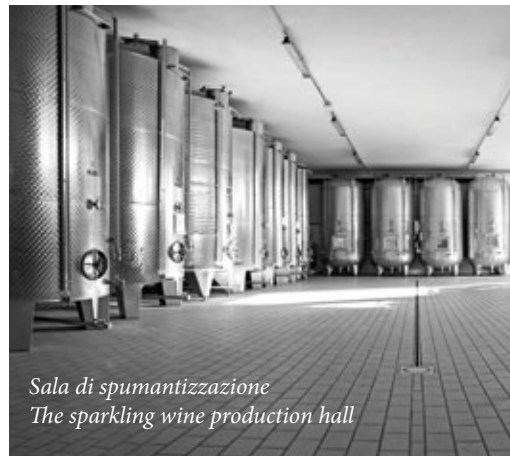
Sala di spumantizzazione The sparkling wine production hall